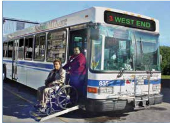
Todos los autobuses de MTA están totalmente equipados para personas discapacitadas.

Las fechas de capacitación se planifican de acuerdo a sus necesidades. Ofrecemos clases diurnas y nocturnas, en días de semana o los sábados.