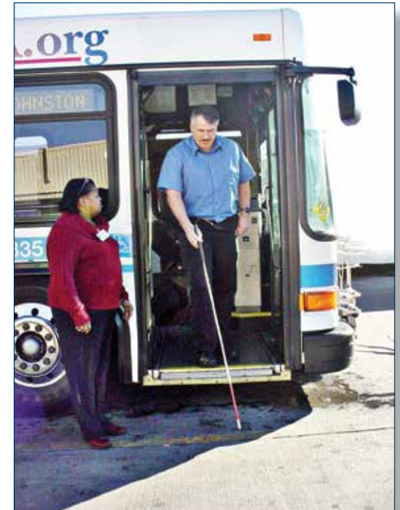
La Capacitación para Viajar ayuda a personas discapacitadas a aprender a utilizar con confianza el servicio de autobuses de MTA al igual que los autobuses y el tren Music City Star de RTA.

Si desea ser remitido a un curso de Capacitación para Viajar o solicitar información adicional sobre el programa, llame a la Oficina de Capacitación para Viajar al teléfono (615) 880-3597.